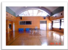
レクリエーションホール