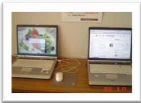
パソコンコーナー