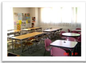
娯楽・飲食コーナー