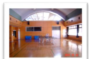
レクリエーションホール