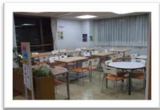
娯楽・飲食・囲碁コーナー