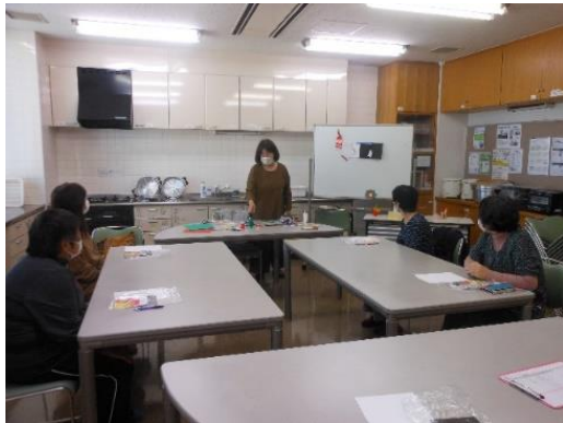
おりがみ教室 開催の様子